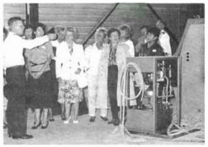
Le Directeur en personne expose les possibilités du radier.