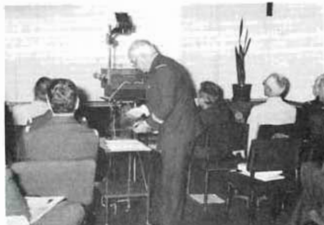
Le Sous-Directeur planche.