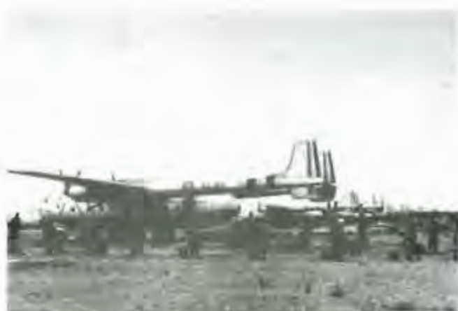
Tymbou (Chypre) Nord Atlas 2501 pendant l'affaire de Suez