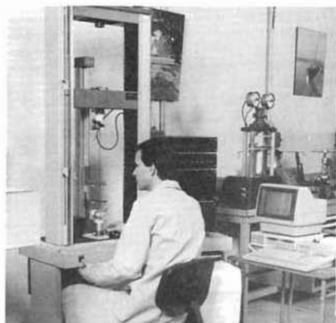
Essai de traction de drisse pour suspente de parachute sur machine de traction de 10 KN.