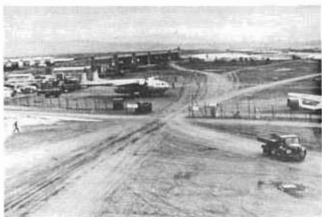
Telergma (Algérie) Nord Atlas 2501 sur la base

Largage à partir d'un Nord 2501 Noratlas "Nord-Aviation" de parachutistes, appareil de la Base Aérienne des Troupes Aéroportées.