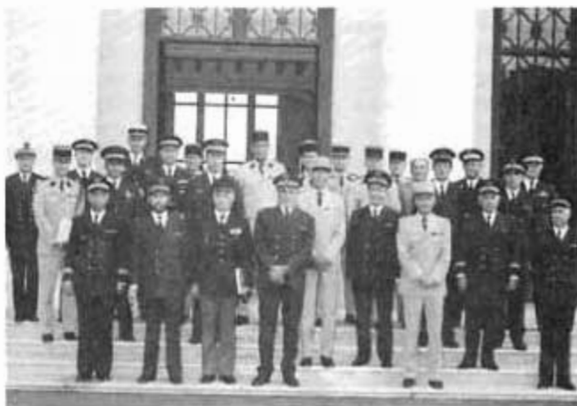
La voie lactée ...