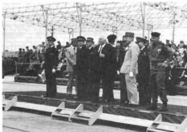
En attendant la revue ...

Après une remise de décoration, dont une plaque de grand Officier de la Légion d'Honneur au Général SALVANT, eut lieu le défilé des troupes. Malgré le vent véritablement furieux, celui-ci fut une splendide parade des troupes à pieds. La seule unité portée fut le 35e RAP de Tarbes qui défila sur des fardiers tous terrains remorquant ses mortiers de 120 millimètres et ses affûts de canons légers anti-aériens.