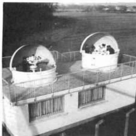
- Z.L. Fonsorbes - P. C. Mesures (P3) équipé de : cinéthéodolites, Contraves, Askania, et caméra vidéo.