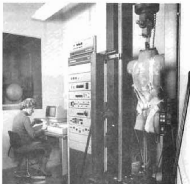
Essai de fatigue d'un harnais d'alpinisme sur machine de traction 200 KN. Le matériel a passé le cap, en sera-t-il de même pour l'utilisateur ?