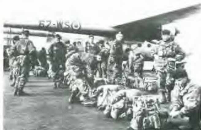
Maison Blanche (Algérie) Embarquement d'un Commando Parachutiste

Le Noratlas participera encore une fois à la logistique avec "grandeur et servitude". Il s'avèrera un instrument robuste et efficace. Il y effectuera également plusieurs missions opérationnelles en particulier des largages de personnels et de matériels.