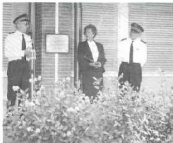
Le mot du Directeur.