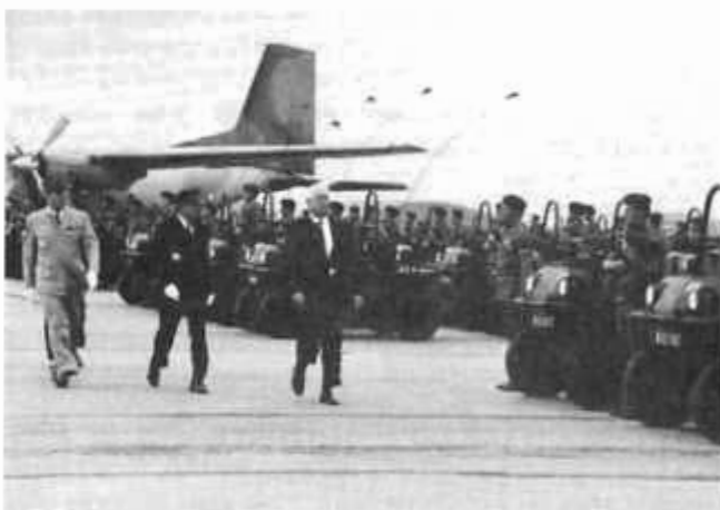
M. André GIRAUD Ministre de la Défense passant les troupes en revue.