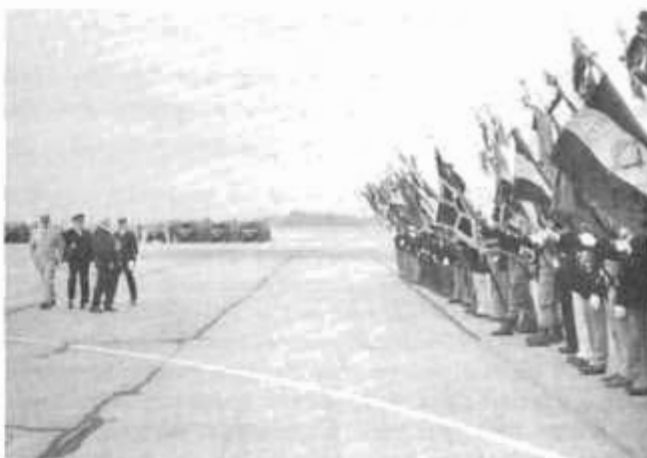
La haie des étendards.