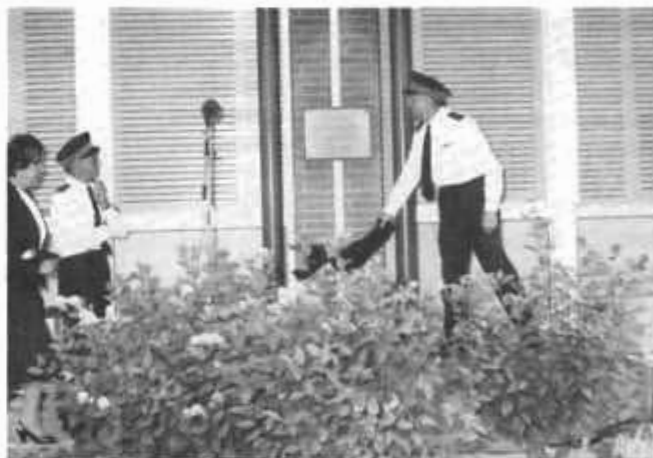
La plaque dévoilée.