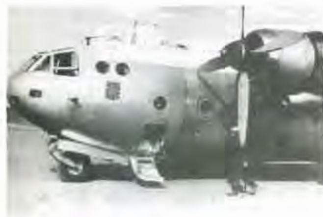
Akrotiri (Chypre) 29.10.56 : Nord Atlas 2501 du Groupe de Transport 1/61 Toulain pour l'opération de Suez

Pour l'anecdote sachez qu'un de ces vaillants serveurs sera utilisé comme PC Volant (1) par le Général GILLES.