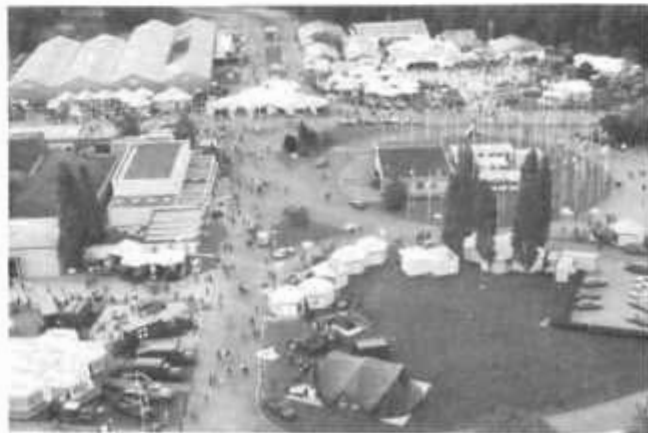
Vue aérienne d'une partie de l'exposition.