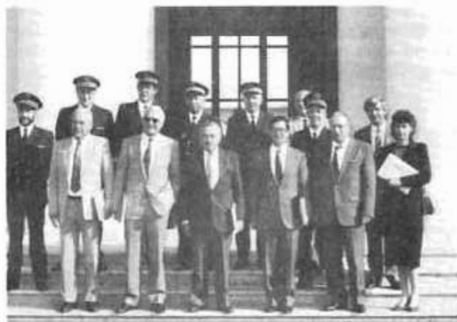
Que de responsabilités sur leurs épaules !