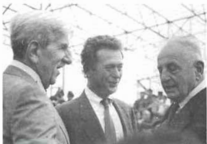
M. BAUDIS entouré des Généraux MASSU et BIGEARD.

D'ailleurs, le spectacle était partout y compris dans l'assistance. Une bonne moitié de celle-ci était pratiquement en uniforme civil : pantalon gris, blazer bleu, chemise blanche, cravate rouge et béret amarante ou vert suivant l'arme à laquelle ils avaient appartenu. Il y avait même quelques calots bleus portés par "les vieilles suspentes".