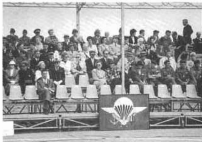
La tribune d'honneur.