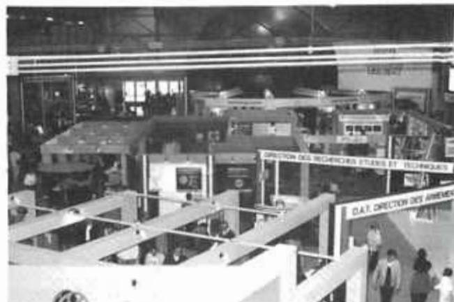
Vue semi-aérienne d'une partie des stands.